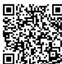
生生用平板— 數位學習