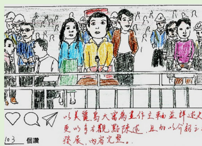
803 楊愛佳/歷史人物 IG/美麗島